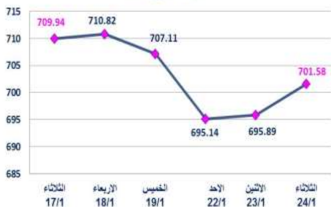
مؤشر السوق ISX60